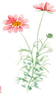
東江 順子 画