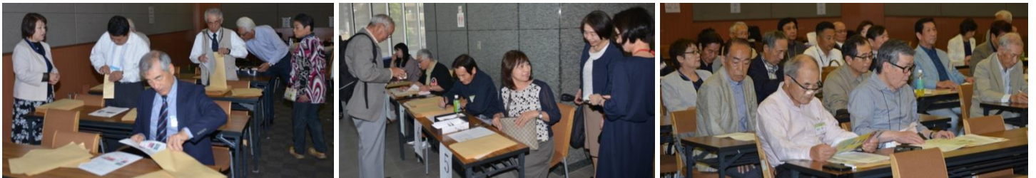
まずは 定期総会・・・ 15時30分開始～