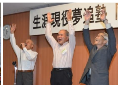
最後は万歳三唱で締め