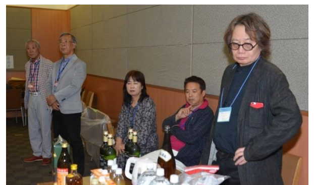
買い出し・おもてなしから後片付けまで、大活躍してくださった12期生のみなさん