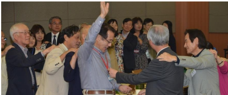
恒例のじゃんけんゲーム