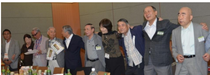
青春時代の大合唱