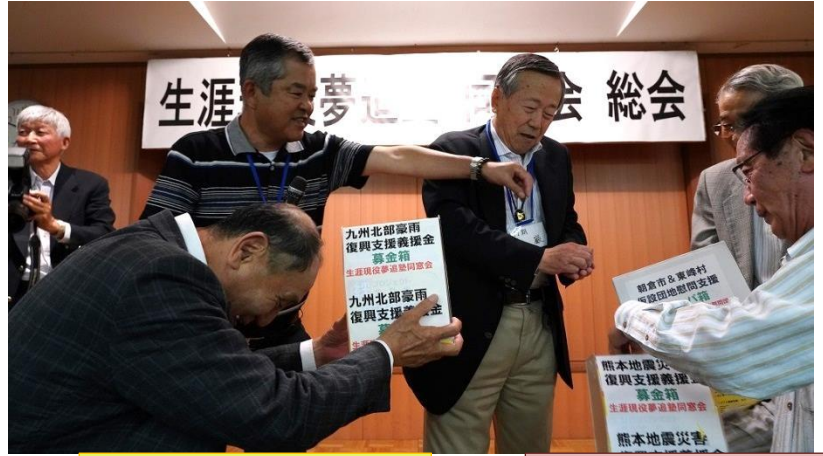
しかし・・・待ち受けていた3つの募金箱へご褒美をすべて投入することに・・・