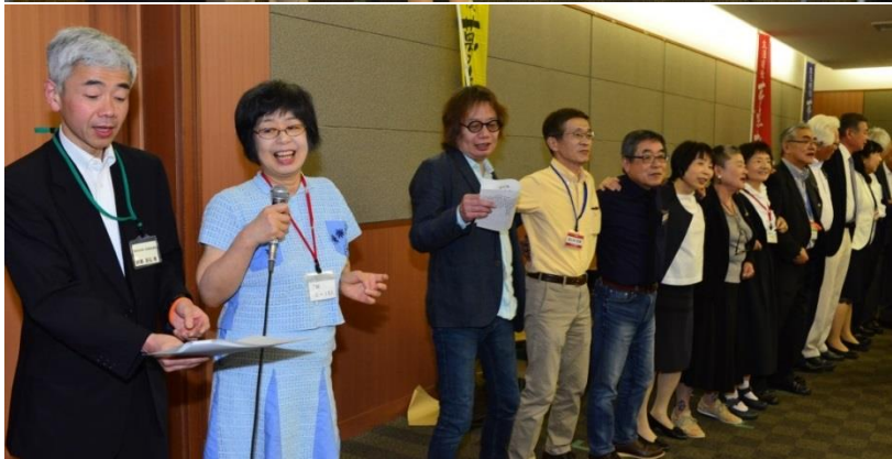
最後は恒例の「青春時代」の大合唱