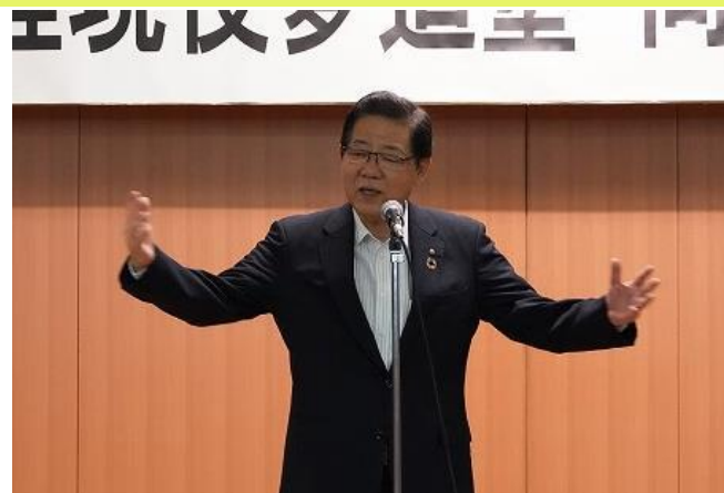
名誉塾長:北九州市長 北橋健治様