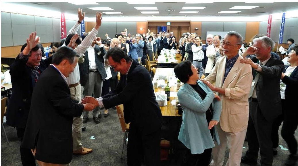
盛り上がった 恒例のじゃんけん大会