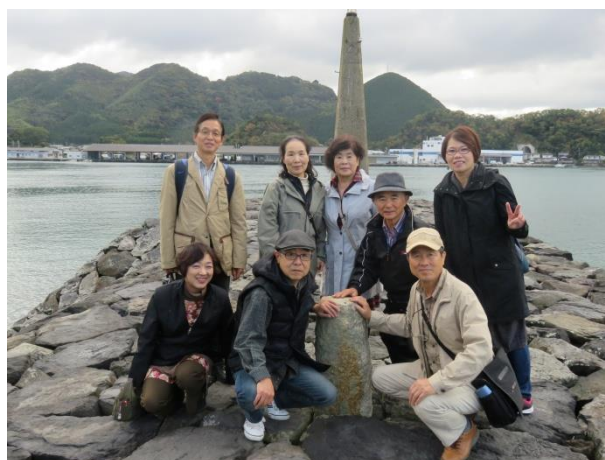
萩の明治革命産業遺産「恵美須ヶ鼻造船所跡」