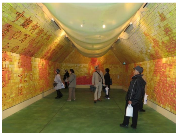
仙崎のまちなか資料館のモザイクアート