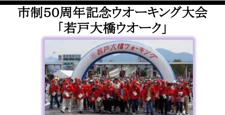
第5回定期総会 広報委員会新設