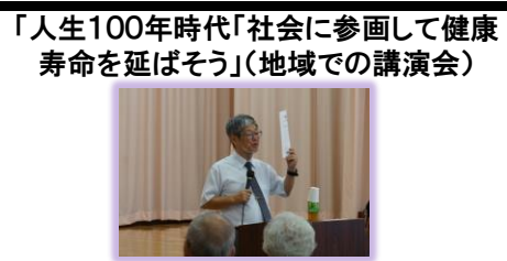
第6回定期総会 H26 すてきな仲間たち