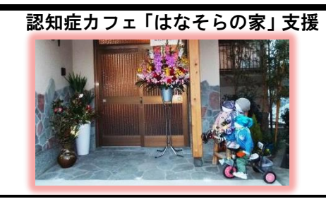
24年設立「ロッキーズ」